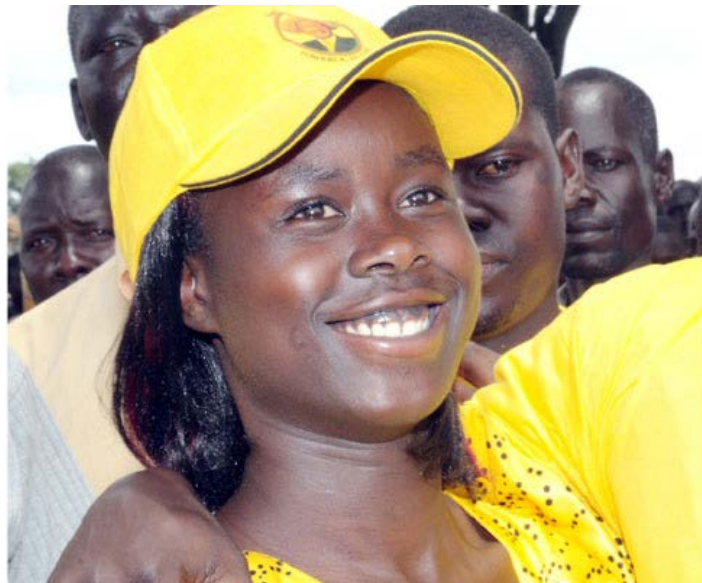
La députée Alengot Oromait.

Proscovia Alengot est membre du Mouvement de résistance nationale, dirigé par le président Yoweri Museveni. D'autres personnes en lice pour ce siège incluaient Charles Ojok Oleny qui a obtenu 5329 votes, Charles Okure de FDC, 2.725, voix et Cecilia Anyakoit de l'UPC, 554 voix.