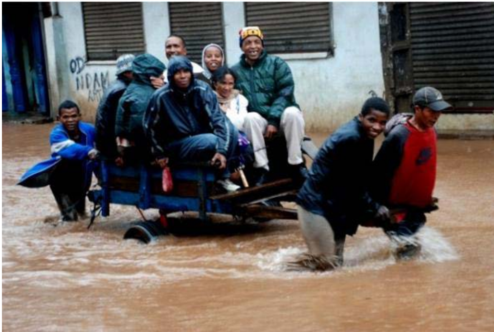
Des Malgaches s'aident mutuellement et gardent le sourire malgré l'inondation pendant le cyclone Giovanna Photo sur Twitter de @aKoloina.

Le cyclone Giovanna a touché terre à Madagascar le 13 février 2012. Il a été classé en catégorie 4, avec des vents atteignant 194 km/heure qui ont arraché arbres et pylones électriques. Il y a eu officiellement au moins 10 morts. Les deux principales villes de Madagascar, Antananarivo et Toamasina, ont été privées de courant pendant une longue durée, faisant de la Saint Valentin une journée noire. Le cyclone n'a pas pour autant assombri le moral des Malgaches, qui ont fait preuve de résilience et se sont aidés mutuellement à s'éloigner des zones inondées, sans cesser d'arborer leurs plus beaux sourires.