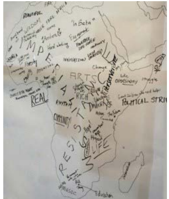
Carte d'Afrique étiquetée par les participants de Barcamp Africa en octobre 2008, source : galerie photo de Maneno sur Flickr.

Le même avait ceci de remarquable qu'il n'a pas seulement réussi à faire jaillir une brassée de réactions en Afrique occidentale, mais s'est aussi propagé à travers le continent à la blogosphère d'Afrique anglophone . Le commentaire à l'époque, de Rombo à "Ce que pense une femme africaine" a fourni une réponse exaltante sur "ce qu'elle aime de l'Afrique :