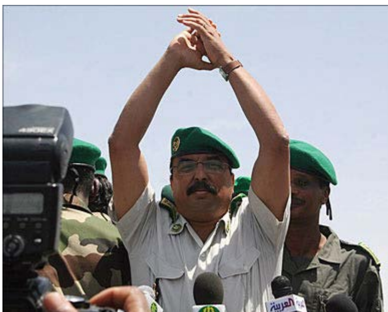
Le président mauritanien Mohamed Ould Abdel Aziz.

Le Président insultait l'opposition, et l'accusait de servir des intérêts étrangers. Il brocardait aussi l'exigence des opposants qu'il soit mis fin au régime. Le Mouvement de la Jeunesse mauritanienne a organisé des protestations contre l'apparition du Général à la télévision, et a appelé à la fin de son pouvoir. Des dizaines de militants de l'I.R.A. [un mouvement abolitionniste en Mauritanie] ont manifesté devant le Ministère de la Justice et le siège de la Radio mauritanienne pour protester contre les déclarations du Président sur l'esclavage à la télévision, qu'ils ont vues comme une condamnation en public de l'esclavage, tout en soutenant en privé les propriétaires d'esclaves.