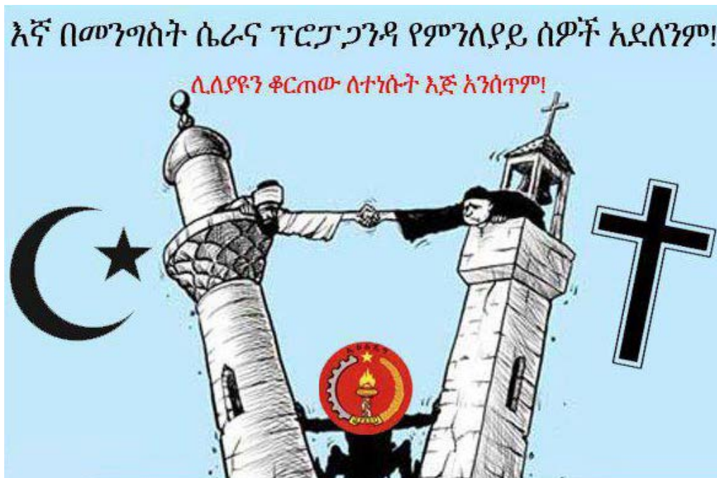
Message de solidarité: nous ne nous laisserons pas séparer par la propagande dégoûtante du gouvernement! Image téléchargée depuis le compte Facebook public de Getu Nigussie.

Ce message d'unité de Obang Metho contient un verset du Coran :