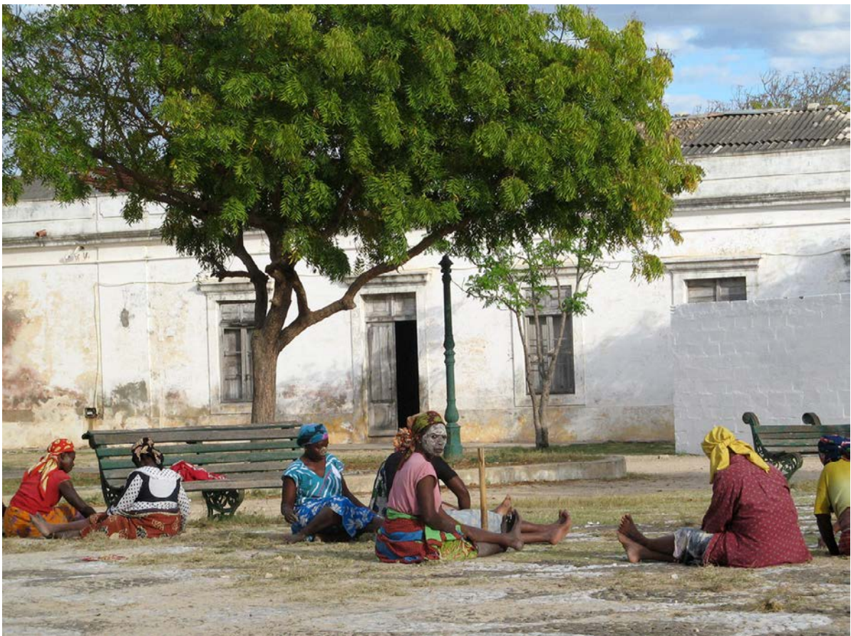
L'île de Mozambique.