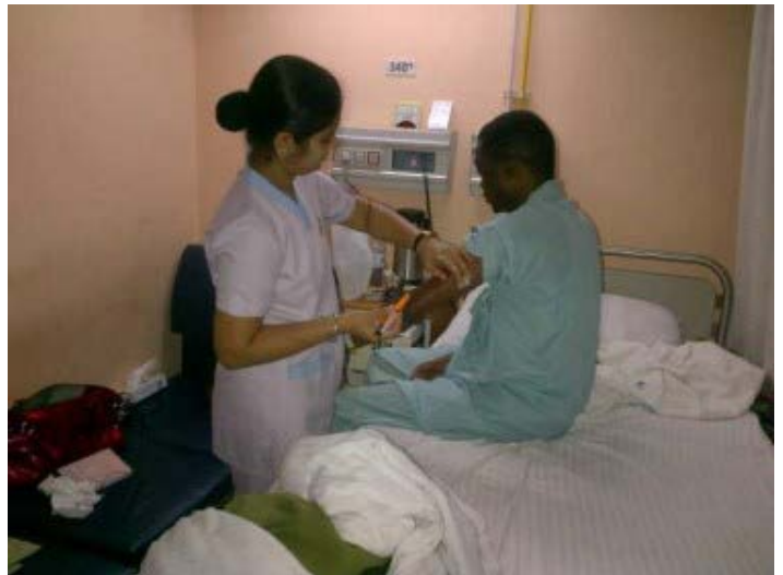
Oke dans un hôpital indien (photo de @seunfakze, 11 Avril 2012).

Si l'on retient ces questions dans sa tête, sans agir, on perd la possibilité de jouir du plaisir de la spontanéité. L'un des outils utilisés dans cette cause sont les médias sociaux, ce qui est suffisant, comme KONY 2012 l'a démontré, dans la République de la blogosphère. Si cette république peut mettre de côté tous les doutes, qui existent légitimement, et agir sans réfléchir, je pense que nous aurons sauvé non seulement Oke, mais nous-mêmes.