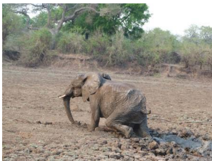
Éléphants embourbés, sauvés, et relâchés.