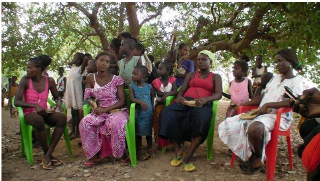
La mandjuandade Enterramento Unido.

Depuis les années 1990, il y a eu une recrudescence de l’initiative et du dynamisme de la société civile de Guinée-Bissau dans tous les domaines – politique, social, économique et aussi organisationnel –, avec une augmentation rapide des associations bénévoles informelles principalement composées de femmes. Ces associations féminines, appelées «mandjuandades» en créole, assument différentes fonctions et poursuivent divers objectifs : l’épargne et l’achat de biens de consommation collective (par exemple, l’achat de tissu avec lequel faire des vêtements, en utilisant le même modèle, portés lors des fêtes et cérémonies), les crédits individuels pour les membres, la célébration de cérémonies familiales et religieuses et même l’organisation d’activités de loisirs.