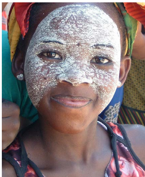
Femme au masque mussiro.

La province de Nampula est traditionnellement connue comme le pays des “muthiana orera”, ou tout simplement, des belles dames. Les femmes de cette partie du pays ont une technique qui leur est propre : elles traitent la peau dès l'âge tendre, en recourant à une espèce forestière recherchée, appelée mussiro, une plante qui d'après la loi doit être protégée et multipliée, et plus généralement utilisée par les communautés pour soigner diverses maladies autant qu'à fins décoratives.