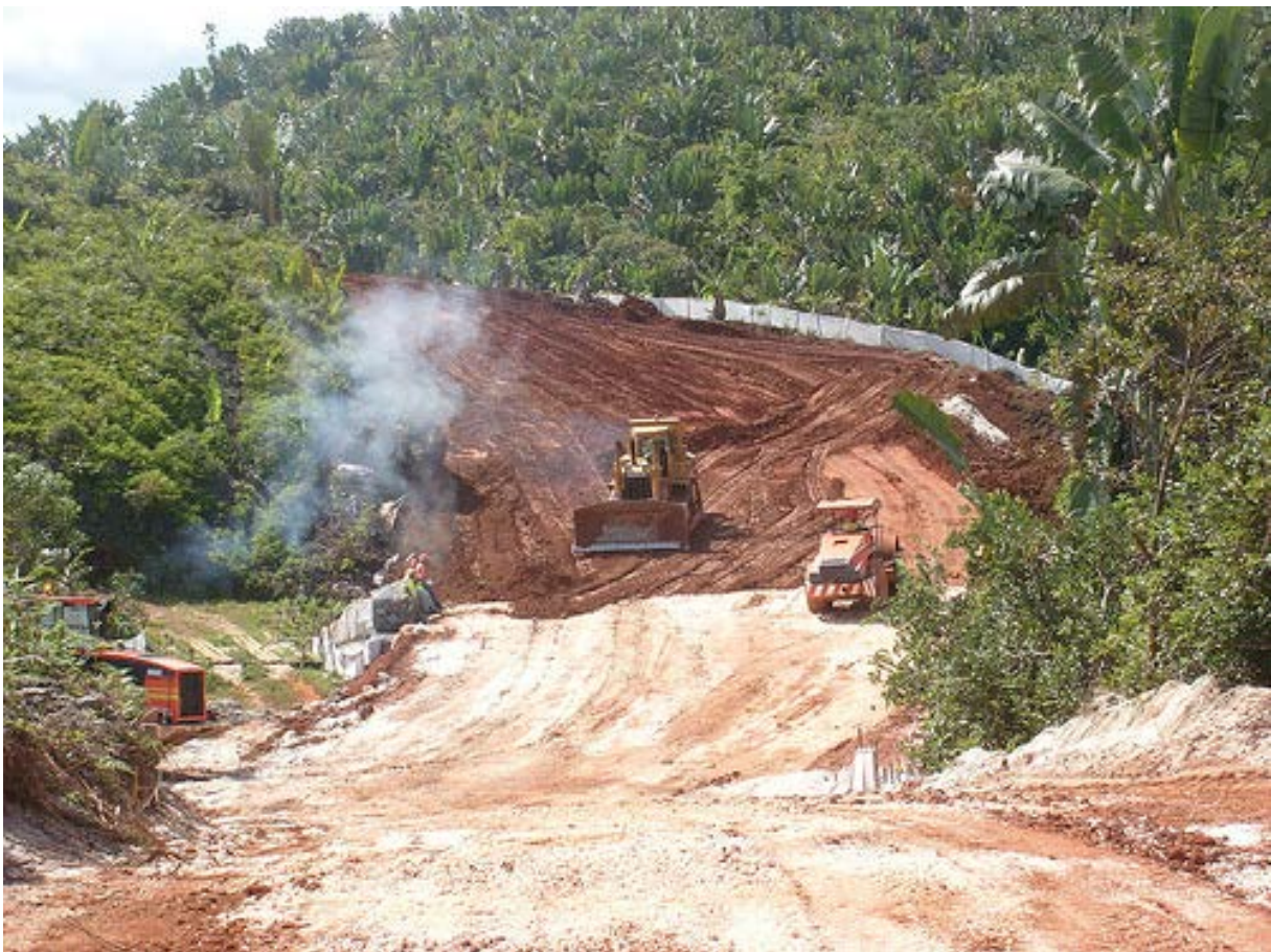
Chantier à Madagascar (reproduite avec l'autorisation de l'auteur).

Madagascar est un des pays les plus pauvres du monde, et en dépit de ses multiples ressources naturelles (y compris le raphia, la pêche et l'exploitation forestière), est surtout connu pour la mauvaise gestion de ses terres arables . Marc Bellemare écrivait dans un récent article (juillet 2012) sur les droits fonciers à Madagascar :