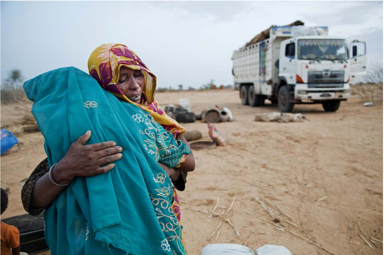
Des personnes déplacées rentrent et sont accueillies dans leurs villages

Des personnes déplacées sont retournées dans leur village d'origine, Sehjanna, après avoir vécu sept ans dans un camp de déplacés à Aramba. Elles sont accueillies par des parents et amis restés sur place. Le programme de rapatriement volontaire est organisé par le Bureau du Haut Commissariat des Nations Unies aux Réfugiés (UNHCR) et la Commission d'Aide Humanitaire Soudanaise.