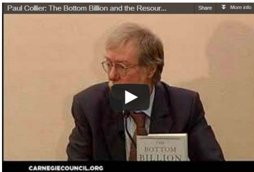
L'économiste Paul Collier parle des effets des exportations de ressources naturelles pour l'Afrique. Vidéo Carnegie Council .

Ils soulignent une variété de facteurs relatifs aux structures économiques, politiques et sociales respectives de ces pays. Premier facteur, le fait que des années 50 à 80 l'Indonésie a été plus vulnérable que le Nigeria aux fluctuations des prix alimentaires mondiaux, parce qu'elle était un gros importateur de riz. Ceci a rendu le gouvernement indonésien plus soucieux de promouvoir le développement agricole que son homologue nigérian. Deuxième facteur, le gouvernement indonésien était plus réceptif aux pauvres, parce que l'armée se sentait une 'fonction double', c'est-à-dire une responsabilité pour les tâches socio-politiques autant que militaires. Et le troisième est que l'élite commerciale de l'Indonésie était essentiellement d'origine ethnique chinoise, ce qui la rendait politiquement vulnérable, alors qu'au Nigeria elle provenait du sud du pays où se situait la principale opposition à l'élite au pouvoir. Autrement dit, les élites au pouvoir des deux pays avaient des intérêts différents au regard de la libéralisation économique.