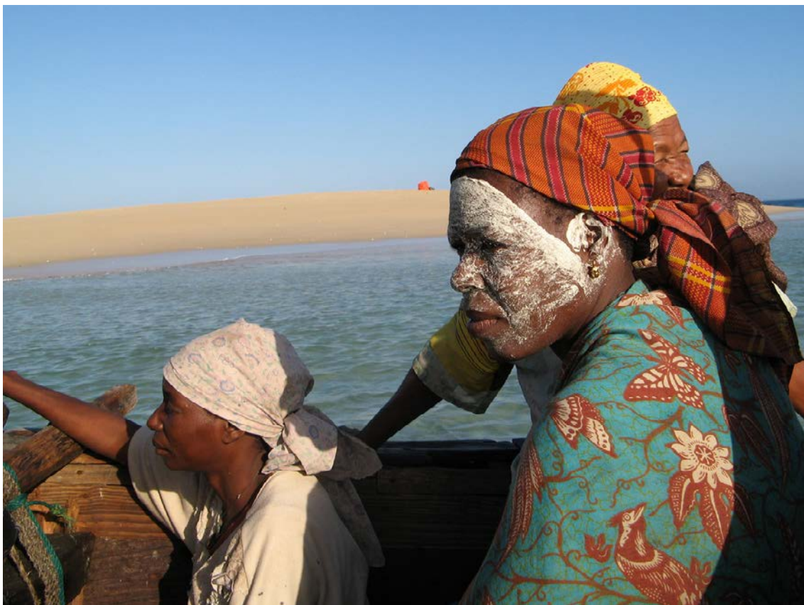
Ile d'Ibo.

Dans la vidéo ci-dessous de Julio Silva, des femmes d'Angoche expliquent comment la tradition a été transmise à la génération actuelle par leurs grands-parents, et elles montrent comment la crème est extraite de la plante Olax dissitiflora à l'aide d'une pierre et d'un peu d'eau :