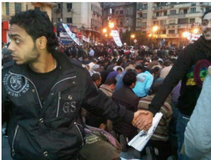
Des coptes égyptiens protègent les musulmans le 3 février sur la place Tahrir ( Photo dans le domaine public ).

Le 3 février, en pleine révolution égyptienne, les chrétiens ont risqué leur vie pour protéger les musulmans priant sur la place Tahrir au Caire, au milieu des violences entre contestataires et partisans du président égyptien Hosni Moubarak. Pour le contexte de ces photos, voyez notre dossier spécial sur la révolution égyptienne .