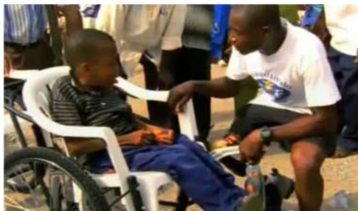
Yeboah discute de la façon de surmonter les handicaps avec un enfant en chaise roulante. Capture d'écran du documentaire Le Don d'Emmanuel .

Emmanuel Oforu Yeboah est un athlète et militant du Ghana, né avec une jambe droite malformée. Yeboah a parcouru 380 kilomètres à travers son pays pour mobiliser et changer les perceptions sur les handicapés, et a ouvert le Fonds éducatif Emmanuel pour les élèves doués porteurs de handicaps.