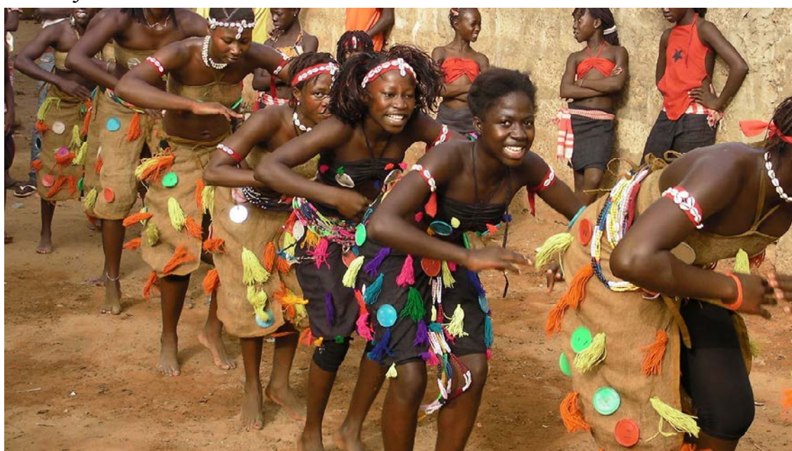
Netos de Bandim.

La réunion a été suivie par des étudiants, des enseignants, des journalistes, des organisations de jeunes et les groupes "mandjuandade".