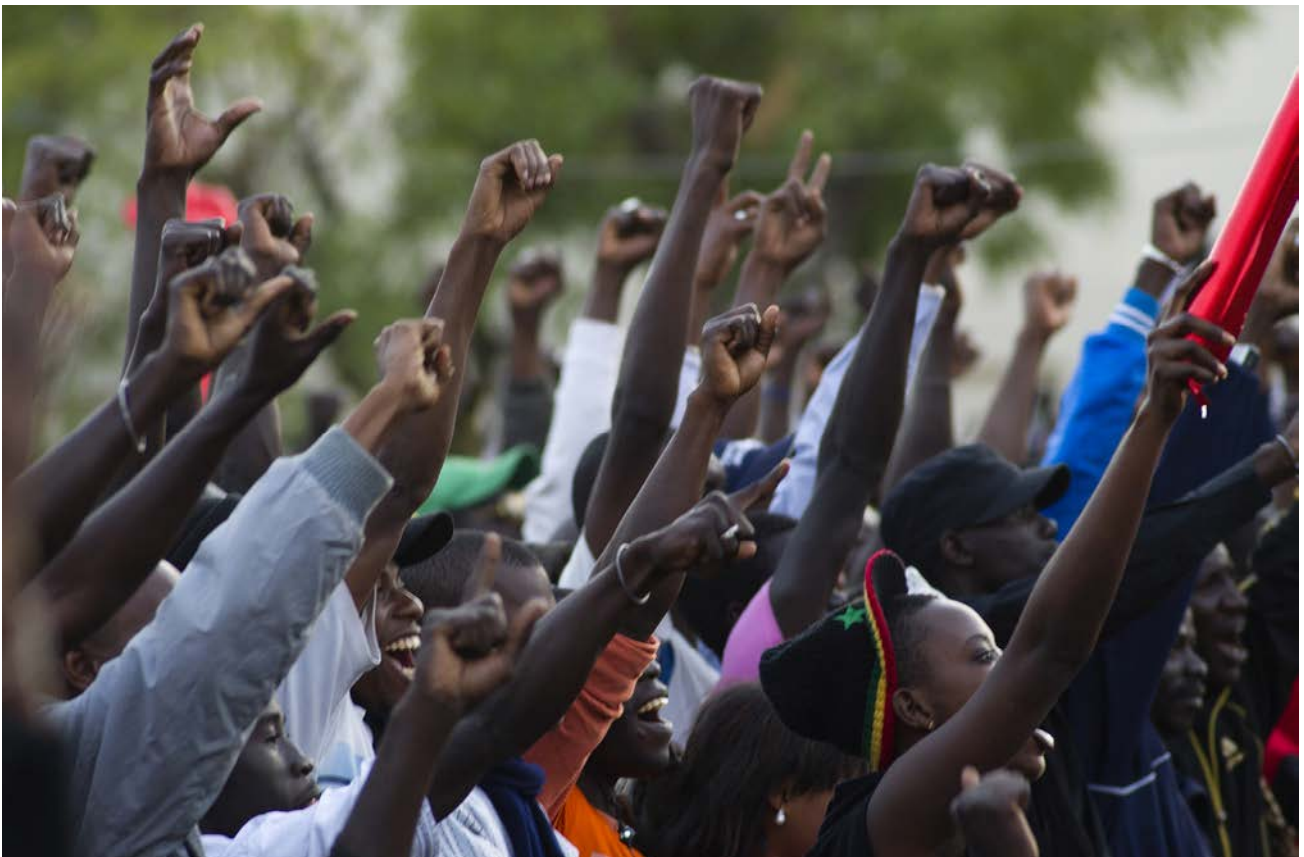
Des manifestants montrent leur joie, photo Nd1mbee sur Flickr , utilisée avec sa permission.

La fin historique d'une période électorale tendue est intervenue au Sénégal le 25 mars 2012. Le président sortant Wade a été battu à l'élection présidentielle après des mois de manifestations contre le népotisme et l'autoritarisme de son pouvoir. Les Sénégalais ont fêté au centre de Dakar la fin pacifique du régime Wade.